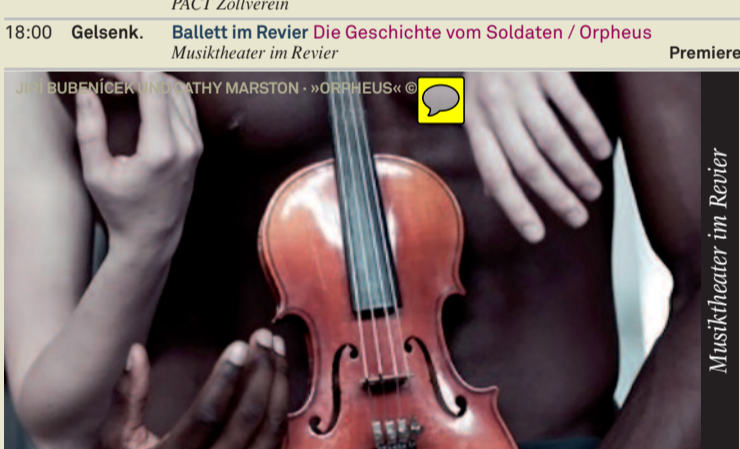
Jiri Bubenicek und Cathy Marston choreografieren diesen Doppelabend: Ein altes russisches Märchen und eine antike griechische Sage, verbunden durch die Musik des russischen Komponisten Igor Strawinsky. Die beiden Helden, ein junger Soldat und ein trauernder Sänger, treibt ein faustisches Streben nach Glück auf die Reise.