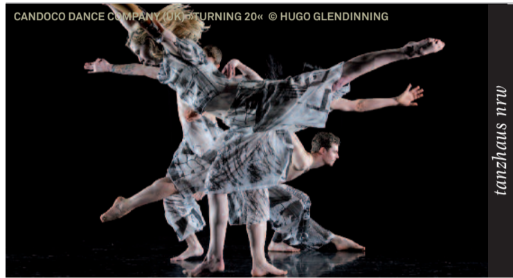
Im Rahmen des Tanzkongress 2013: Die Candoco Dance Company gibt einen Einblick in ihre integrative Arbeit mit behinderten und nichtbehinderten Tänzern. Das britische Ensemble zeigt eine Rekonstruktion von »Set and Reset«, dem Meisterwerk der amerikanischen Choreografin Trisha Brown, sowie eine zeitgenössische Arbeit des französischen Choreografen Rachid Ouramdane.