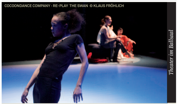
Das berühmte Solo der Tanzgeschichte wurde mehrere tausend Male getanzt, und immer wieder stirbt er aufs Neue. »Der Schwan« ist in der neuen Produktion von CocoonDance selbst nie zu sehen, jedoch wird das Schwanen-Motiv für die Choreografie zum Katalysator. Hochintelligent wird das abstrakte Thema der Wiederholung in eine ebenso anspruchsvolle wie beeindruckend schöne Choreografie umgesetzt. Es ist ein Highlight der NRW-Tanzszene. (choices.de).